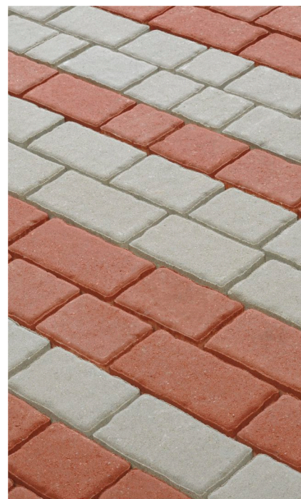
mit unregelmäßiger Fuge | grau und rot