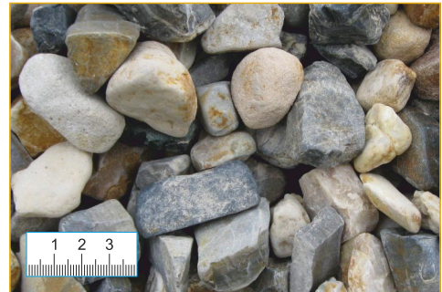
Kies 16-32 mm (Abb. 1:2,5)