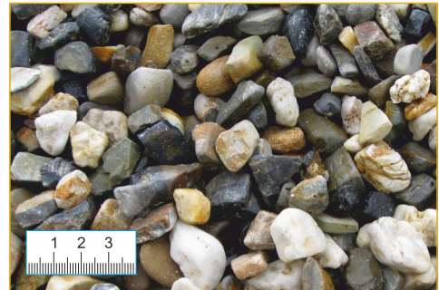
Kies 8-16 mm (Abb. 1:2,5)