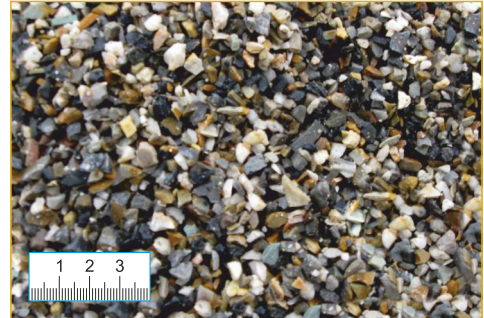
Splitt 2-5 mm (Abb. 1:2,5)