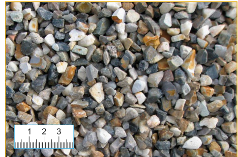
Splitt 5-8 mm (Abb. 1:2,5)