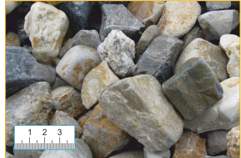
Zierkies 32-63 mm (Abb. 1:2,5)