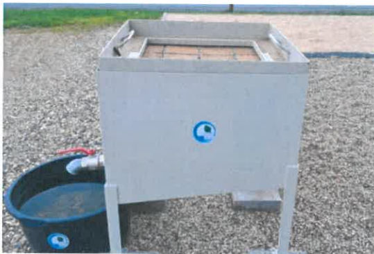
Bild 1: Testmodell zur Prüfung der Versickerungsfähigkeit von Pflaster mit einem Systemaufbau