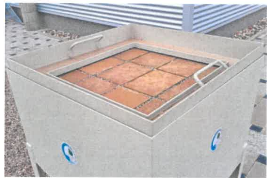
Bild 2: Rahmen mit Öffnung 60 x 60 cm zur Begrenzung und Abdichtung der zu prüfenden Pflasterfläche