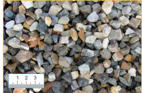
Bezeichnung (Abb. 1:2,5)