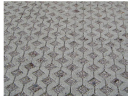
Rasengitterplatten | grau

Farbpalette (weitere Farben auf Anfrage möglich)