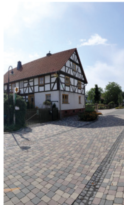
gerompelt | grau, anthrazit und dunkelbraun