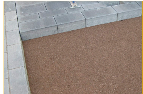
Bettungs- und Fugensand